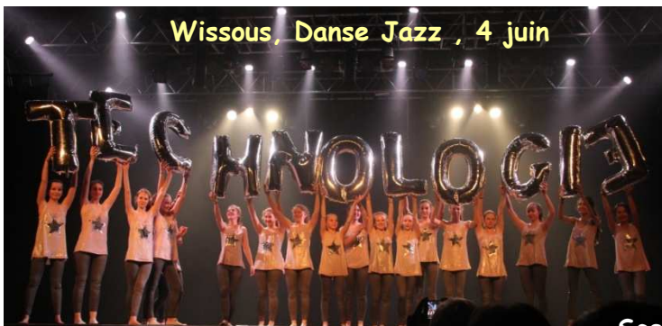
Wissous, Danse Jazz , 4 juin

Parc de Sceaux, Orch. à cordes et Chœur, 21 juin